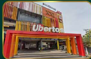
Dekat Ubertos Ujung Berung Town Square