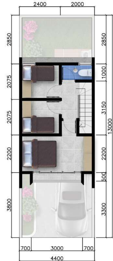
Denah Lantai 2