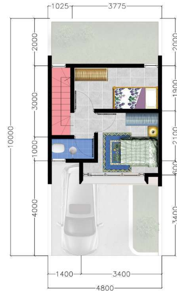
Denah Lantai 2