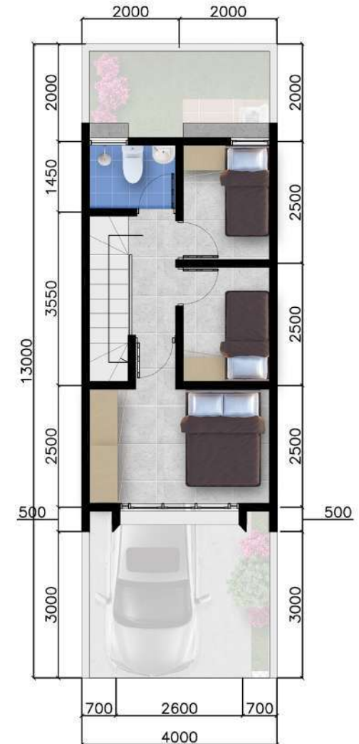
Denah Lantai 2