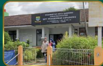
Dekat Puskesmas Cipadung