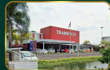
Dekat Transmart Carrefour Cipadung