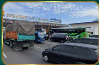
Dekat Gerbang Tol Cileunyi