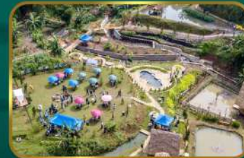
Dekat Wetland Park Cisurupan