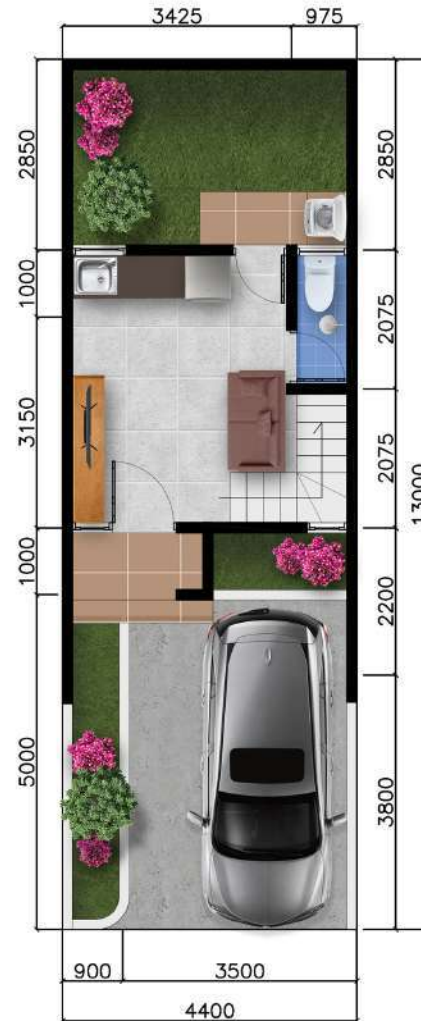
Denah Lantai 1