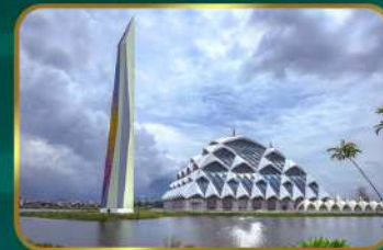
Dekat Masjid Raya Al-Jabbar