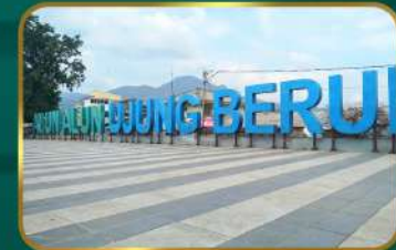
Dekat Alun-Alun Ujung Berung