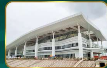
Dekat Stasiun Kereta Cepat