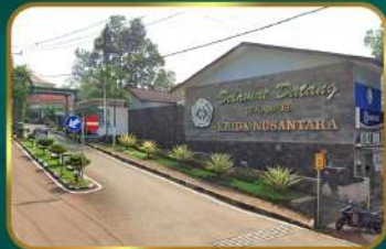
Dekat SMA Krida Nusantara