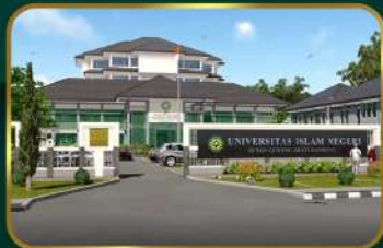
Dekat UIN Sunan Gunung Djati