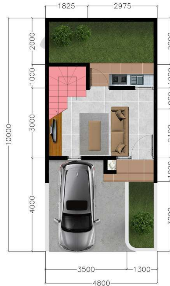
Denah Lantai 1