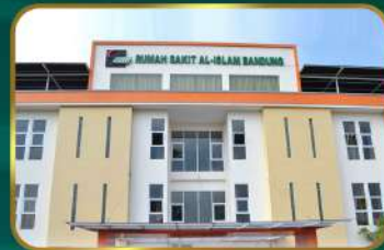
Dekat Rumah Sakit Islam Bandung