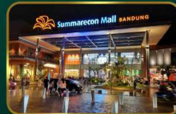
Dekat Summarecon Mall Bandung